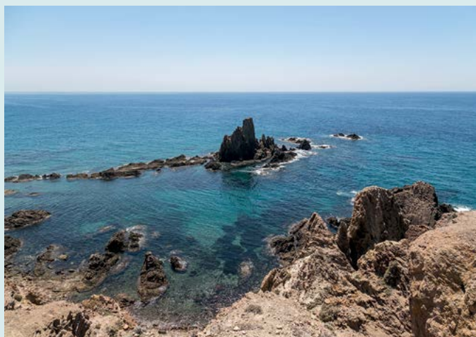
Parque Natural de Cabo de Gata

Modna i droga mekka windsurferów i kitesurferów (zob. s. 94).